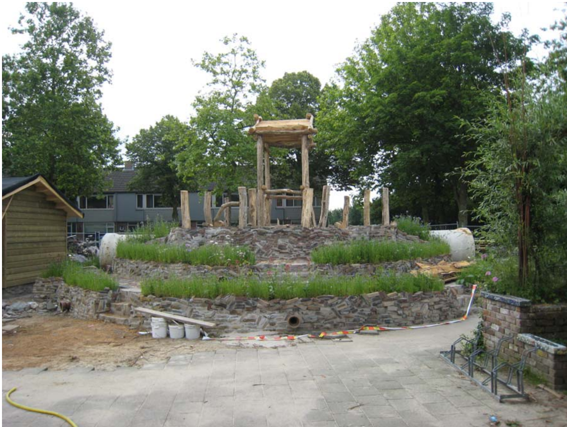
Schijndel, Educatief Centrum Oost

Een voorbeeld dat meer arbeid, ruimte en geld vereist, is het Educatief Centrum Oost in Schijndel, waar al langer gewerkt wordt aan een natuurrijke buitenruimte. Hier zijn verschillende voorzieningen op het terrein ingericht. Schooltuinen waar groenten en vruchten worden geteeld, kunnen belangrijke bijdragen leveren aan natuur- en milieu-educatie en kennis van gezonde voeding. Het eten van zelfgeteelde groenten is een sensatie.